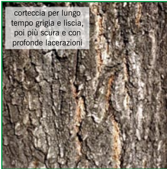
corteccia per lungo tempo grigia e liscia, poi più scura e con profonde lacerazioni