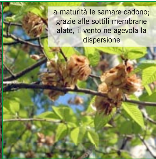
a maturità le samare cadono; grazie alle sottili membrane alate, il vento ne agevola la dispersione