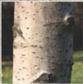
corteccia per lungo tempo grigia e liscia, poi più scura e con profonde lacerazioni

fiori a sessi separati portati da piante diverse (specie dioica ); fiorisce prima della fogliazione