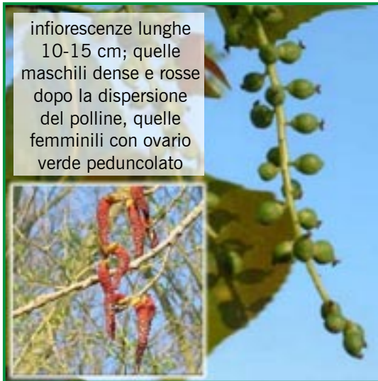
infiorescenze lunghe 10-15 cm; quelle maschili dense e rosse dopo la dispersione del polline, quelle femminili con ovario verde pedunculato