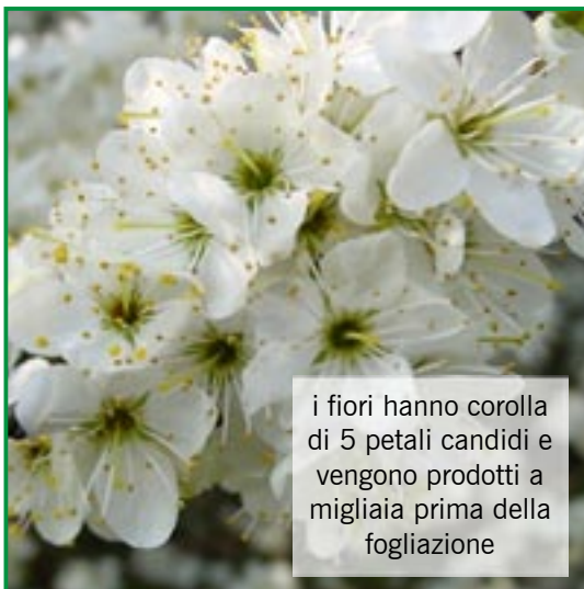
i fiori hanno corolla di 5 petali candidi e vengono prodotti a migliaia prima della fogliazione